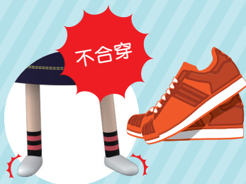
波鞋不合穿，要買新波鞋