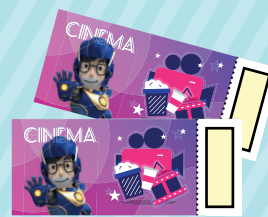
新上映的動畫門票