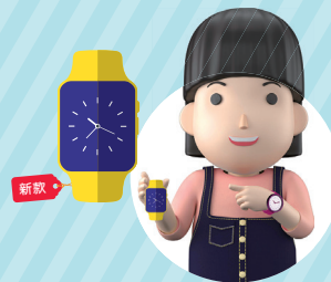
已經有手錶，想要最新的閃燈款