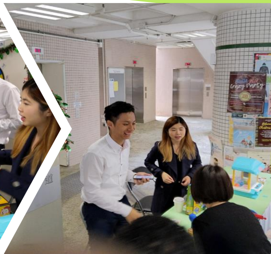
(二) 回答「網上理財」的問題