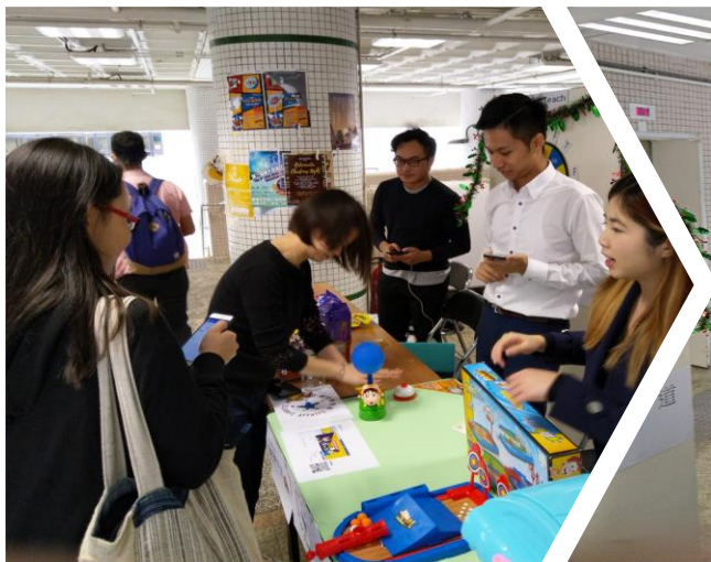
(一) 抽籤並進行小遊戲